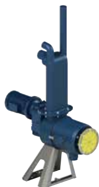
SEPCOM® X 125