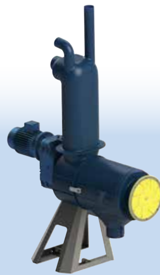
SEPCOM® X 300