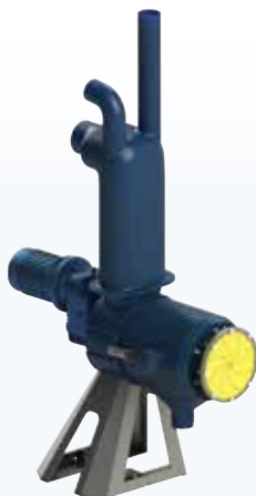
SEPCOM® X 200