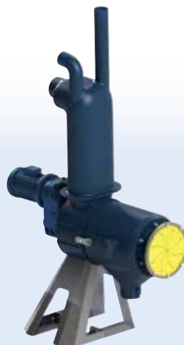
SEPCOM® X 250